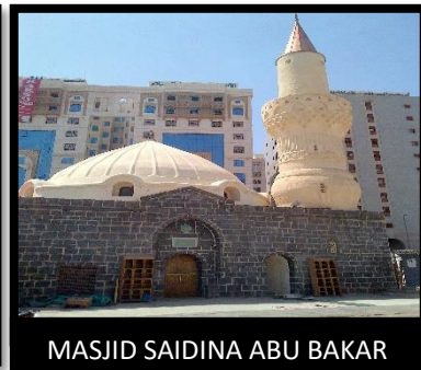
MASJID SAIDINA ABU BAKAR